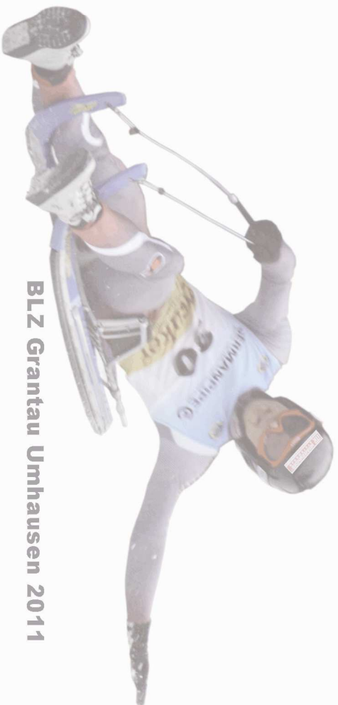
BLZ Grantau Umhausen 2011